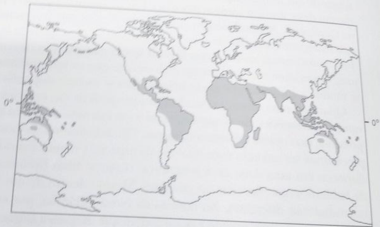
Fig. 4.1 Mapa da distribuição mundial da família das palmeiras (Palmae), uma família de plantas pantropi